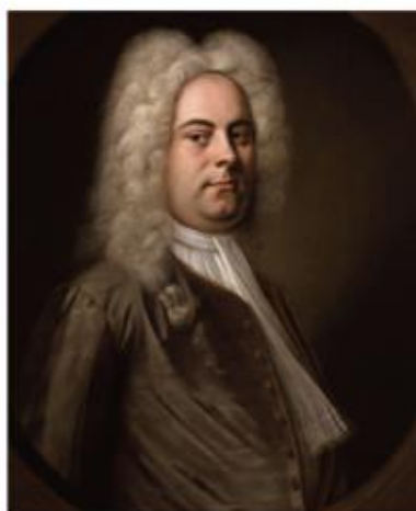
George Frederick HANDEL