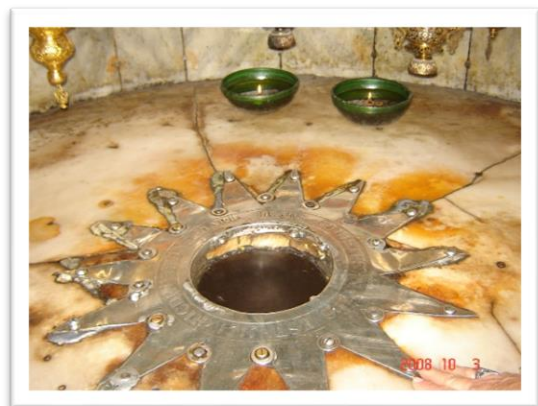
Inkijk in de geboortegrot van Jezus

De tweede excursie ging naar Jordanië. Per boot kwamen we aan in Acaba en reden daarna per bus dwars door de woestijn. Er staan hier nogal wat kleine, nieuwe maar vaak onbewoonde huisjes.